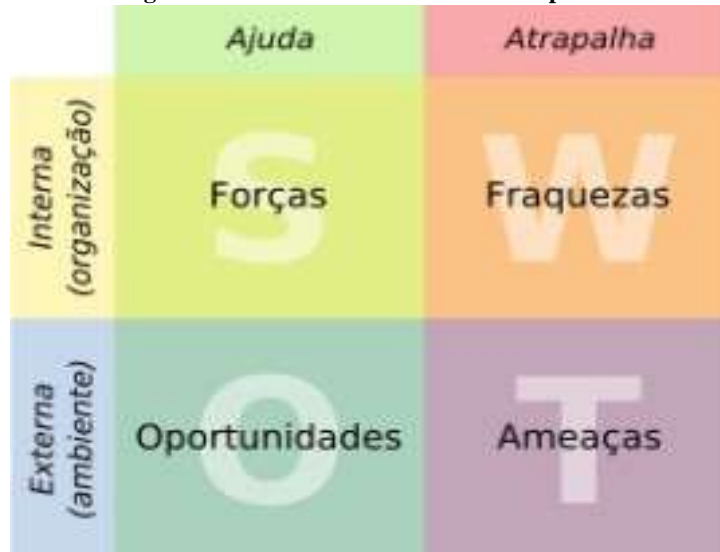
Figura 1. Modelo de Análise SWOT simplificada